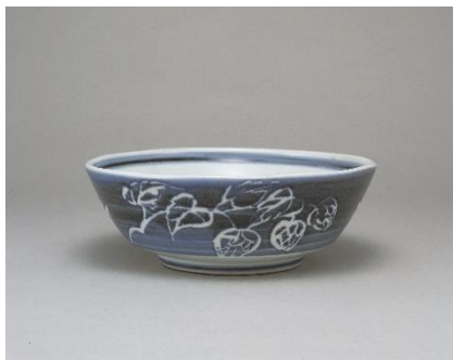
富本憲吉《白磁染付蠶抜ホップ文鉢》 当館蔵