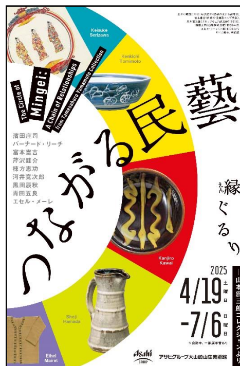
ポスタービジュアル