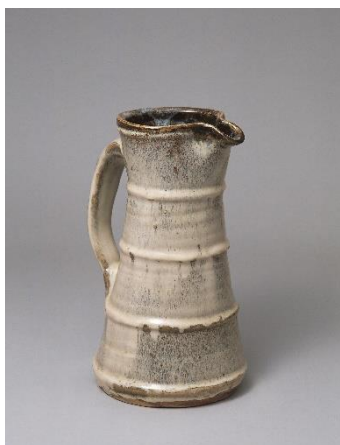
濱田庄司《白釉胴紐注瓶》 1960年頃 当館蔵