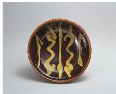
河井寛次郎 《スリップウェア線文鉢》 1931年 当館蔵