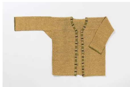
エセル・マーレ《上着》 1920年代 当館蔵