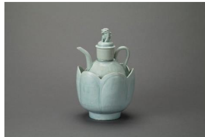
《青白磁水注》 景德鎮窯/北宋時代(11~12世紀)/愛知県陶磁美術館蔵