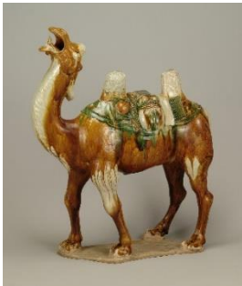
《三彩駱駝》 鞏義窯/唐時代(8世紀)/愛知県陶磁美術館蔵