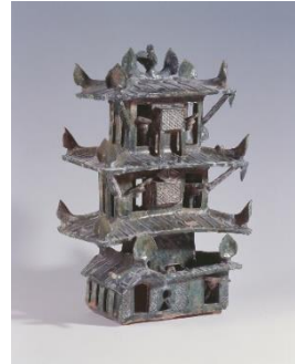
《緑釉樓閣》華北/後漢時代(1~2世紀)/愛知県陶磁美術館蔵