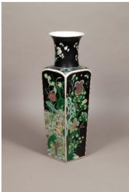
《黒地素三彩四季花図方瓶》 景德鎮窯/清時代(17~18世紀)/愛知県陶磁美術館蔵