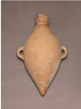
《紅陶尖底双耳瓶》 黄河中流域/新石器時代中期・仰韶文化半波類型(紀元前5000~紀元前4000年頃)/愛知県陶磁美術館蔵