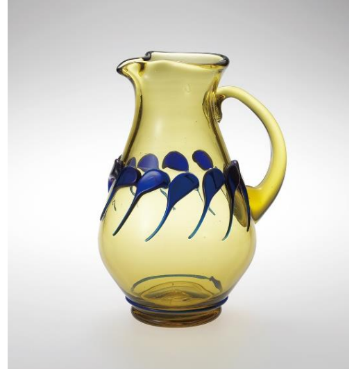
《リーフ文ピッチャー》1994年