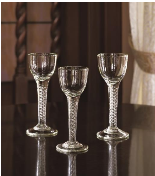
《エアーツイストワイングラス》1977-87年